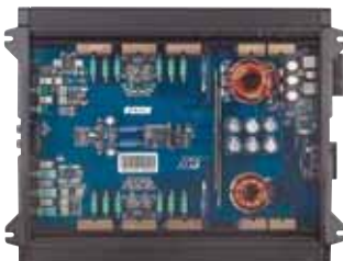
Vertrauen erweckend: viel Platz und sauberes Layout

Etons PA-Serie hat einen hervorragenden Ruf, den die PA 1502 in unserem Test verteidigen muss. Optisch klar als Vertreterin dieser Serie zu identifizieren, bestätigt sie ihren Qualitätsanspruch bereits im Inneren. Eine saubere, komplett SMD-bestückte Platine erfreut das Auge, die Elna-Kondensatoren im Netzteil sind für ihre klanglich positiven Eigenschaften hinlänglich bekannt. Auch ausstattungs-technisch weiß die Eton zu begeistern. Hoch- und Tiefpass sind gleichzeitig aktivierbar, was die Realisierung eines Bandpasses zulässt. Die untere Grenzfrequenz des Hochpasses ist zudem tief genug, um einen Subwoofer mit einem Subsonicfilter zu schützen.